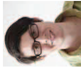
France Santi Kommunikation

Für die letzte Nummer dieses Jahres hat sich das Magazin insieme dem Thema Schreiben angenommen. Wir wollten wissen, wie die Schreibbegabungen und -bedürfnisse von Menschen mit geistiger Behinderung unterstützt werden können (Schwerpunkt S. 8–11). Sich schreibend ausdrücken ... für ein Magazin eigentlich eine ganz natürliche Sache. Das Thema lag auch deshalb auf der Hand, weil wir das Verbandsorgan "insieme" 2012 gründlichen Betrachtungen unterzogen: Die Redaktion, unterstützt von eigner aus Eltern zusammengesetzter Begleitgruppe, hat seine Bedeutung überdacht und für die Zukunft neu entworfen.